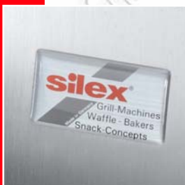
Acier Inox brossé