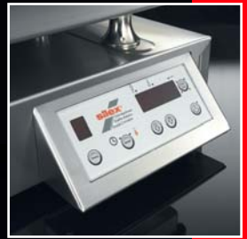
Commande entièrement numérique sous verre