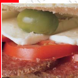
Snackwich - diversité et variation