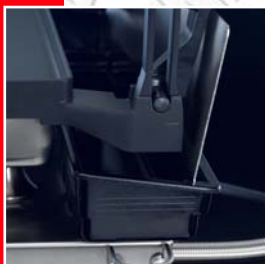
Collecteur de la graisse