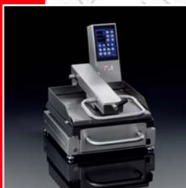
Disponible en version S-Tronic S 165