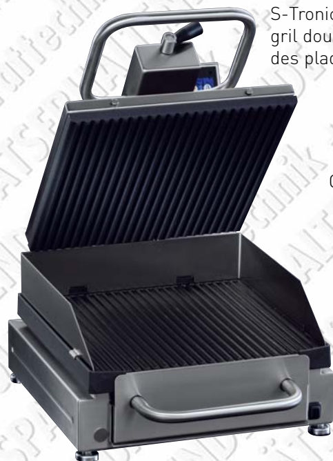
S-Tronic 165 GR gril double contact avec des plaques striées