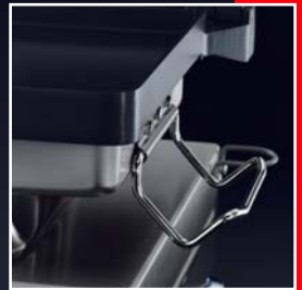
Cadre sandwich escamotable