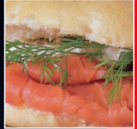
Petit pain avec remplissage au choix