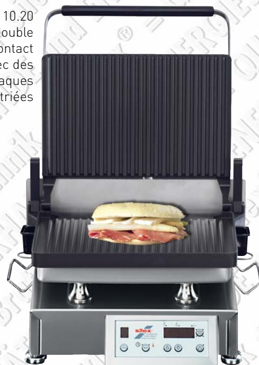
GTTPowerSave® 10.20 gril double contact avec des plaques striées